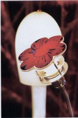
Lámpara de mesa con flor. Línea "Naturalesa". D+U Dosmasuno

continuó los primeros días de noviembre en NorCenter, que inaugurará su nuevo espacio de diseño "Life-style Mall", del que Design Connection by Cienporciento diseño formará parte. Luego, el mundo, pues la muestra se reeditará en 2008 en la Semana del Diseño de Milán y en la Feria Internacional del Mueble de Nueva York. ■