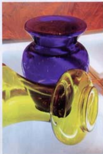
Banquetas transparentes La Bohème, Philippe Starck