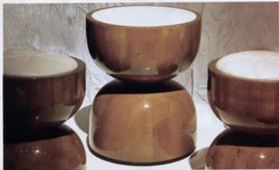
Butacas y mesita de madera y cuero de la línea Bowl. Irizar/Kon